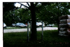
Изглед сл. 2