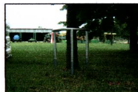
Изглед сл. 1